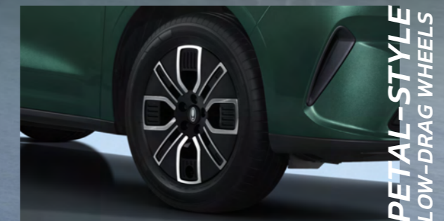
PETAL-STYLE LOW-DRAG WHEELS

ไฟหน้าแบบ LED ดีไซน์เอกลักษณ์ทรงหยดน้ำ พร้อมระบบเปิด-ปิดอัตโนมัติ