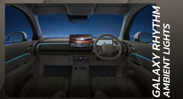
GALAXY RHYTHM AMBIENT LIGHTS

หลังคากระจกพาโนรามาิก เพิ่มความโล่งสบาย ภายในห้องโดยสาร พร้อมม่านบังแดดไฟฟ้า*