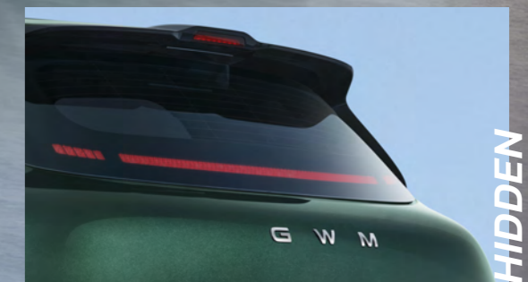
HIDDEN DESIGN TAILLIGHT

ไฟท้าย LED ดีไซน์แบบซ่อนให้กลมกลืนไปกับตัวรถ และที่ปัดน้ำฝนด้านหลัง