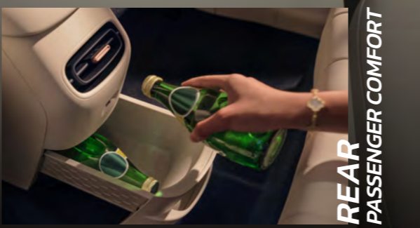
REAR PASSENGER COMFORT

แผงบังแดด พร้อมกระจกขนาด 8.8" และไฟส่องสว่าง LED*