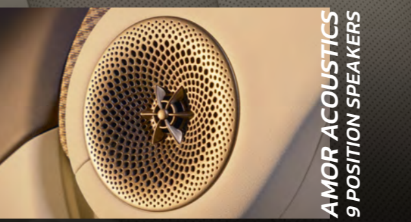
AMOR ACOUSTICS 9 POSITION SPEAKERS

ช่องปรับอากาศสำหรับผู้โดยสารด้านหลัง พร้อมช่อง USB-C และช่องเก็บความเย็น ขนาด 3.2 ลิตร