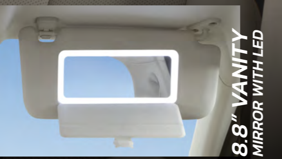
8.8" VANITY MIRROR WITH LED

ไฟห้องโดยสาร ปรับเปลี่ยนบรรยากาศ การขับขี่ได้หลากหลายอารมณ์*