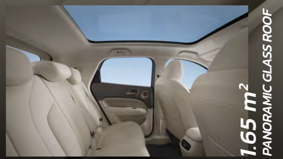
1.65 m 2 PANORAMIC GLASS ROOF

ยุคใหม่! ของความสะเทวกลสบาย สไตล์ SLEEK & SPORTY ภายในโดดเด่นด้วยแนวคิด DARK GOLD CONTOUR DESIGN เน้นเส้นสายที่โค้งมน ให้ความรู้สึกกว้างสบาย พร้อมกับโทนสีอันเป็นเอกลักษณ์