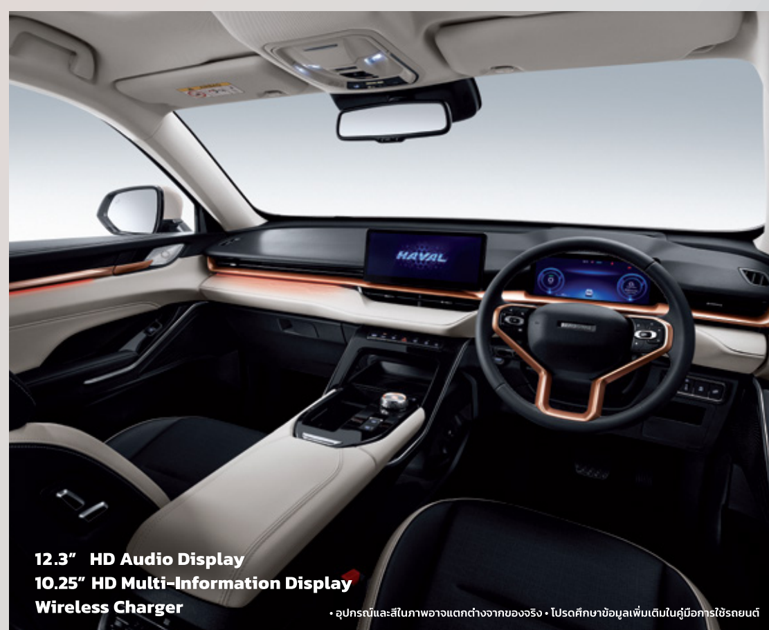
12.3" HD Audio Display 10.25" HD Multi-Information Display Wireless Charger