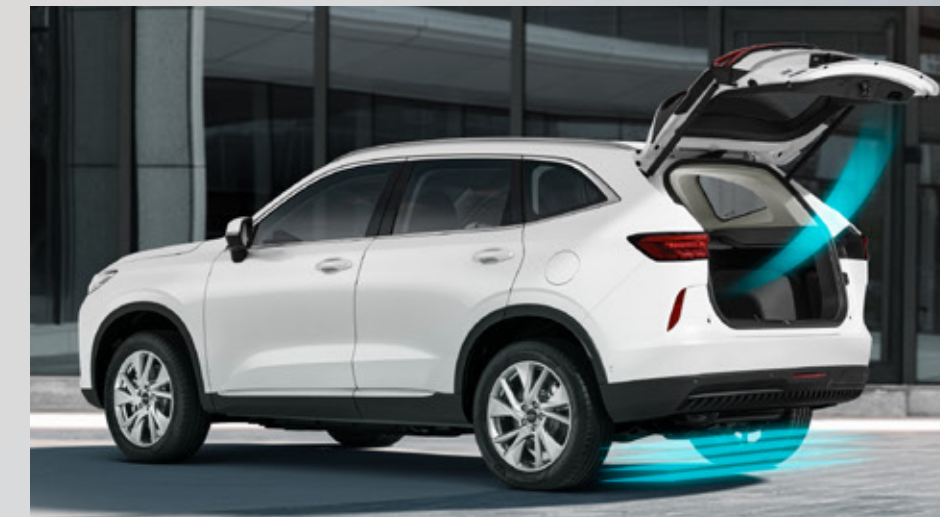
Electric Tailgate with Kick Sensor

คมกึ่งดีไซน์ ชัดถึงประสิทธิภาพ ด้วยไฟหน้า LED ให้แสงสว่าง นุ่มนวลแบบ Ultra-High Flow เพิ่มความมั่นใจ ปลอดภัย ยิ่งขยับยาค่าขึ้น