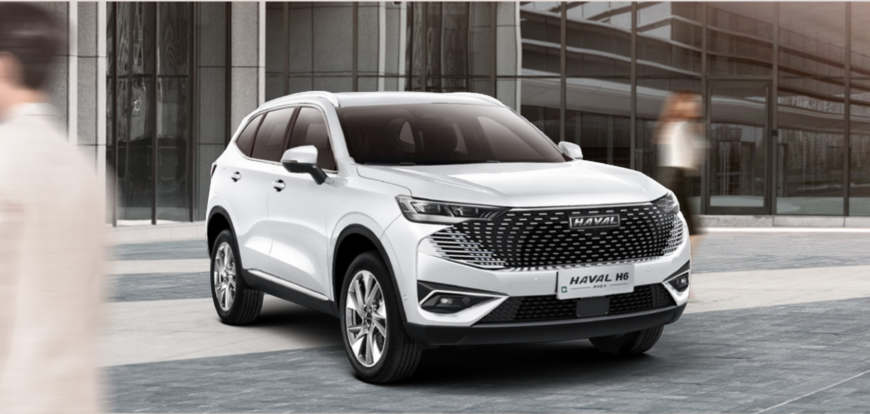
Star Matrix Front Grille & Intelligent LED Headlamp